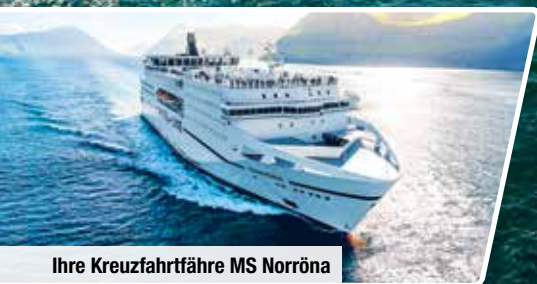
Ihre Kreuzfahrtfähre MS Norröna

Erlebnis-Paket mit 4 Ausflügen, Halbpension & Getränkepaket Unterhaltungsprogramm an Bord Panoramafahrten auf den Färöer-Inseln und auf Island