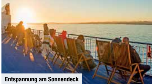
Entspannung am Sonnendeck