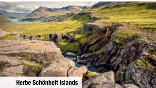
Herbe Schönheit Islands