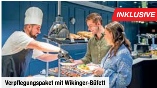
Verpflegungspaket mit Wikinger-Büfett