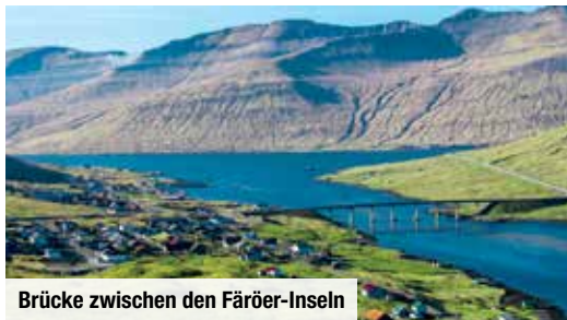
Brücke zwischen den Färöer-Inseln