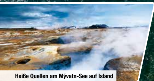
Heiße Quellen am Mývatn-See auf Island